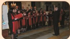
Chiesa Madre Ore 20,30 Seconda Rassegna corale Mariana