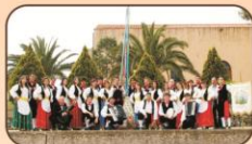
Spettacolo del gruppo folkloristico "U Casteddu"