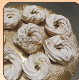
TARALLI DI CARNEVALE