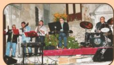
Intrattenimento musicale con gli "Amici di Caccamo"

I Buccellati, detti anche "dolcini di Natale", vengono confezionati artigianalmente dai pasticceri locali con sfoglia di pasta fresca, il ripieno è a base di mandorle triturate e cioccolato oppure fichi secchi triturati. Una volta elaborati, vengono infornati e subito dopo spolverizzati con zucchero e cannella.